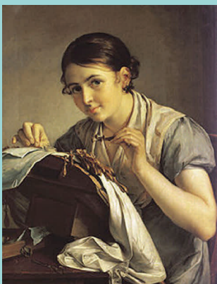
В. А. Тропинин «Кружевница» (1823)

Новый вид рукоделия – плетение узора из нитей на коклюшках – привезён в Россию из Западной Европы в начале XVII века, где кружевоплетение появилось во второй половине XVI века (до этого были известны лишь шитые кружева). Вот тогда-то слово «кружево» укрепилось именно за сплетенными ажурными изделиями, не имеющими тканой основы.