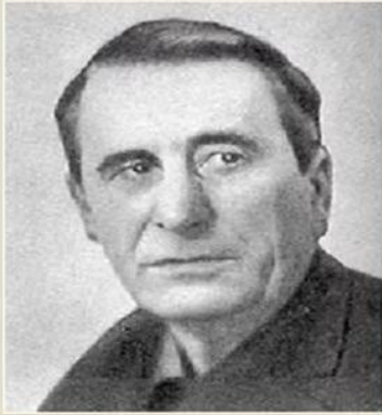
Вячеслав Кондратьев 1920-1993

В декабре 1941 года направлен на фронт. В 1942 году 132-я стрелковая бригада, в составе которой воевал Кондратьев вела тяжелые бои под Ржевом. Во время них получил первое ранение, был награждён медалью «За отвагу». После окончания отпуска, полученного по ранению, воевал в железнодорожных войсках. Был повторно и тяжело ранен. В госпитале пробыл на излечении полгода, выписавшись инвалидом.